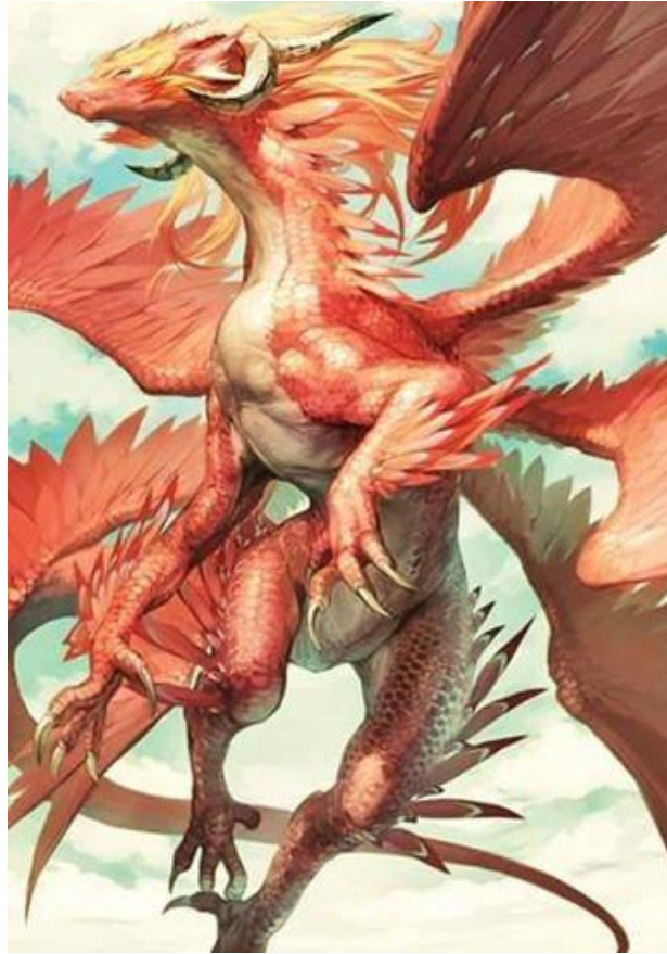
Dragon Bélier Piréus (Primat secondaire)