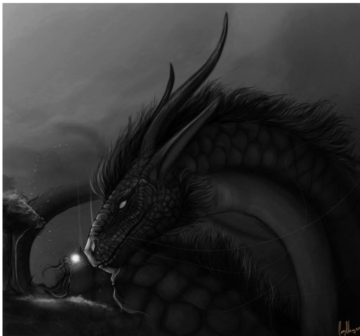
Dragon Morloch    poils longs et    cornes. Il n'y a pas d'  cailles, que des poils.