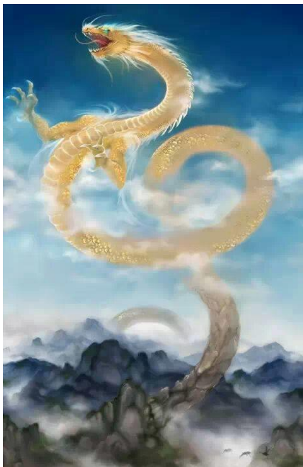
Imogi Céleste Doré