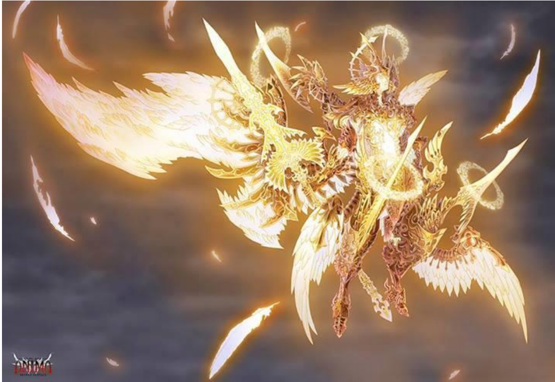
Primat Solaris b  h  moth sacr   (l'un de mes Dragons)