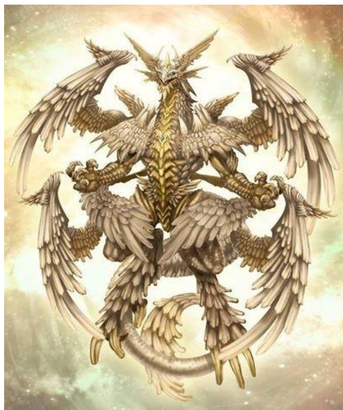
Solaris b  h  moth secondaire