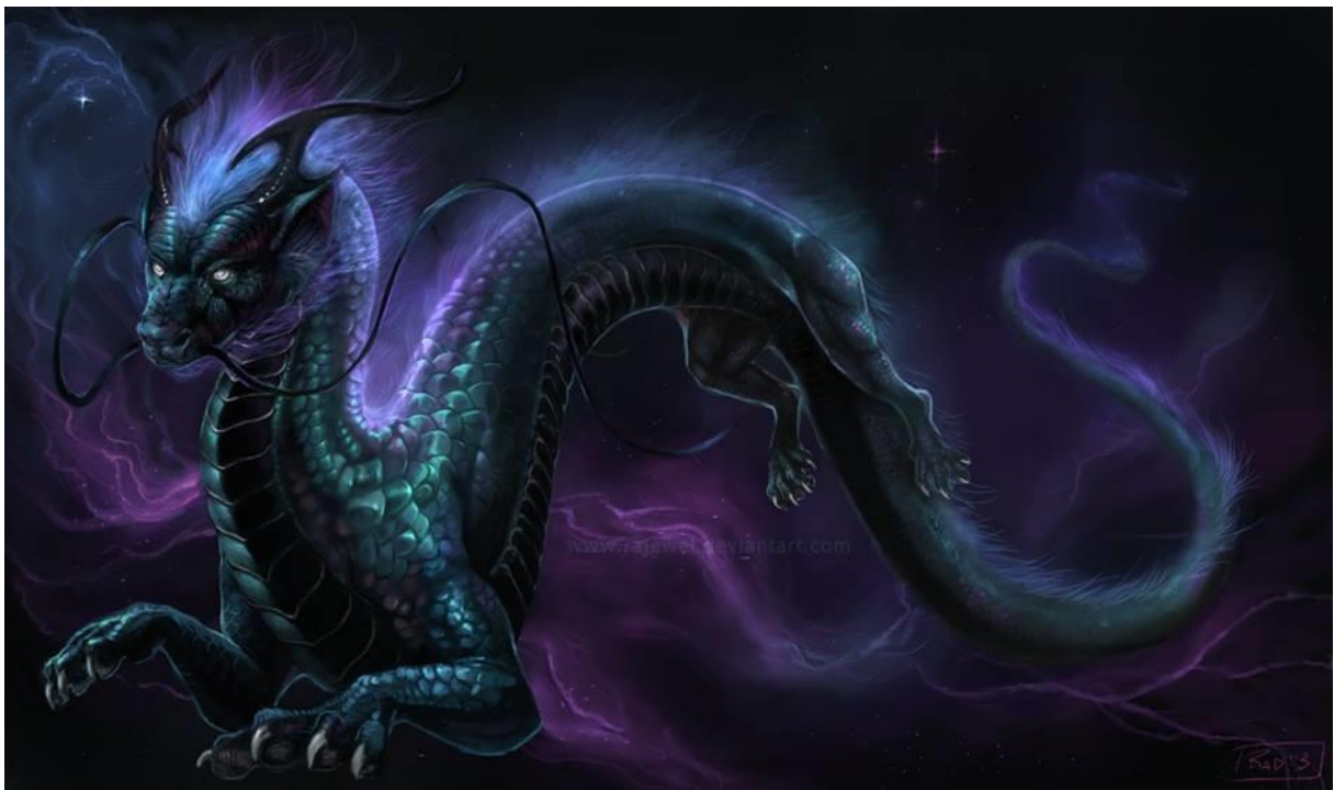
Dragon Imoga c  leste