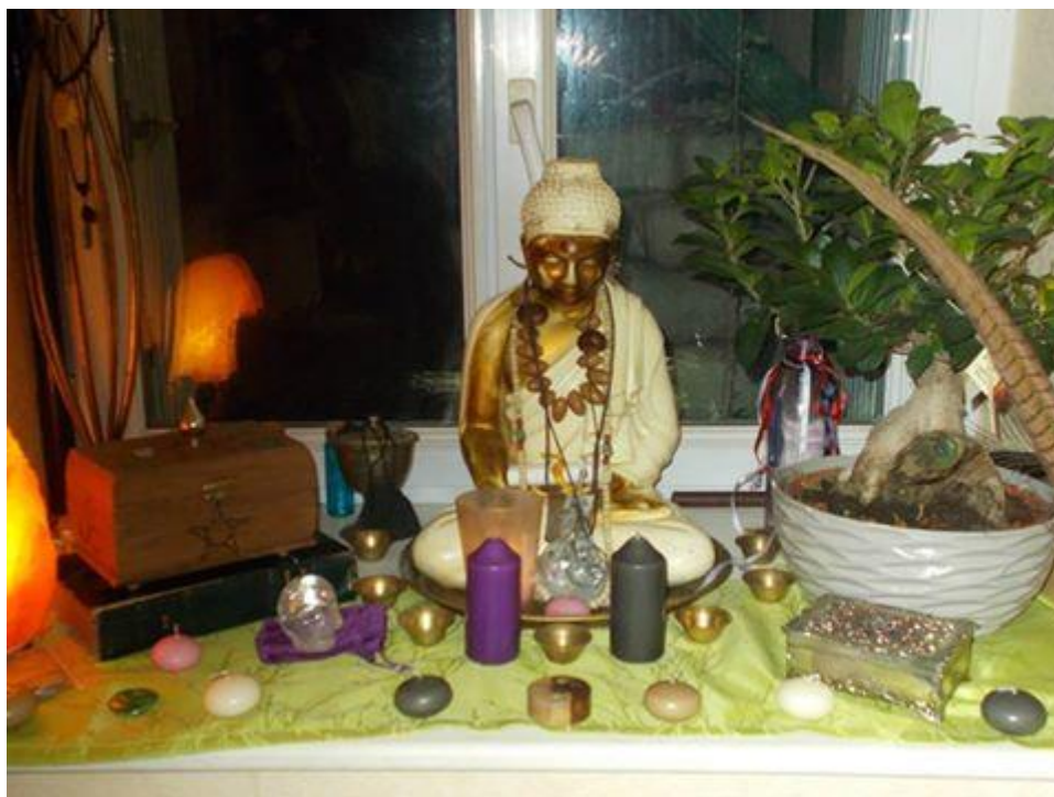
Mon Autel Draconique avec le Bouddha contenant le parchemin ancestral

Mon parchemin prophétique se trouve à l'intérieur mon Bouddha vieux de 2 000 ans (photo). De par le cœur de mon Bouddha, les Dragons sont bien et bel protégés.