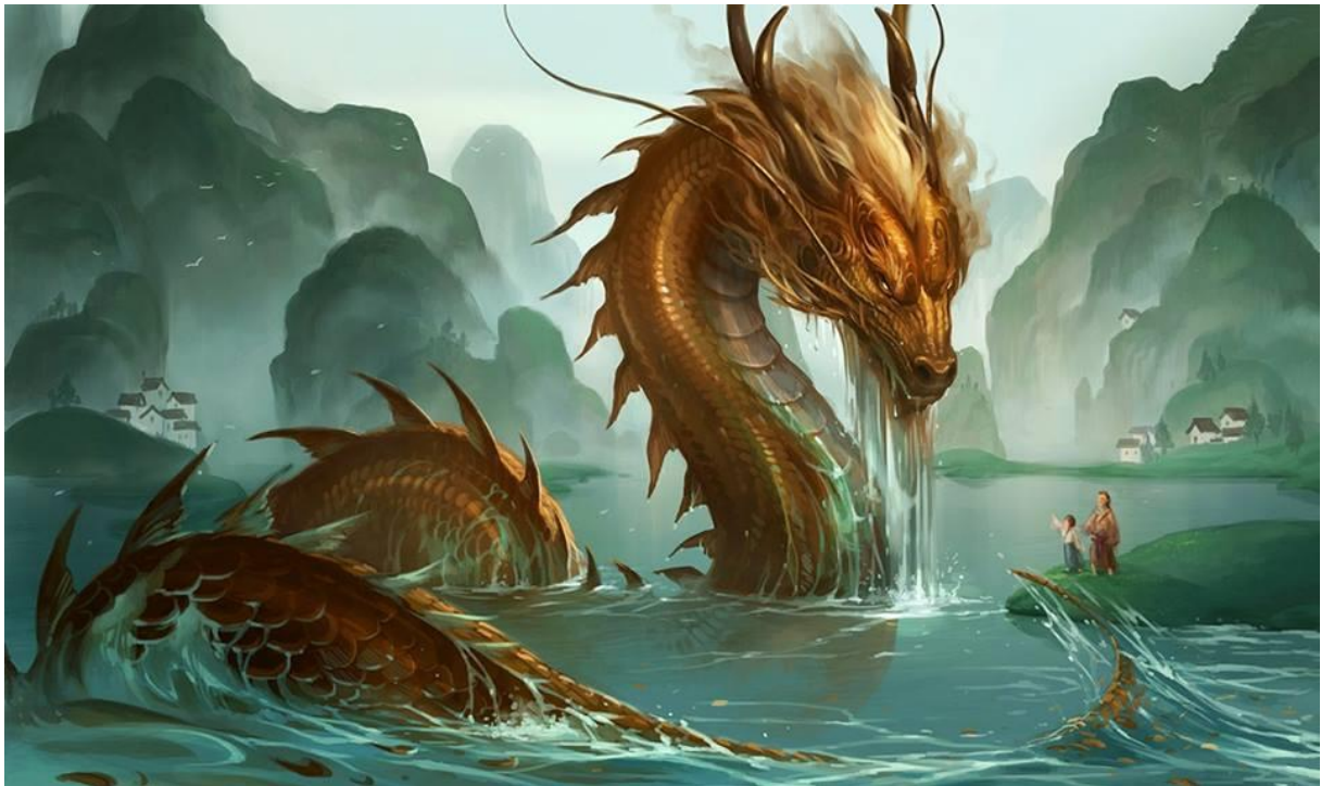
Imogi doré d'eau

C'est important, car ils sont purement et simplement liés à l'eau. Les Imogis d'eau sont les principaux (cf. image ci-dessus), mais il y a bien sûr les Algouniks à peau rugueuse, mais aussi les Mégaelis à dos lisse. Il y a aussi les Imogis dorés d'eau et les Algouniks, dont voici les illustrations :