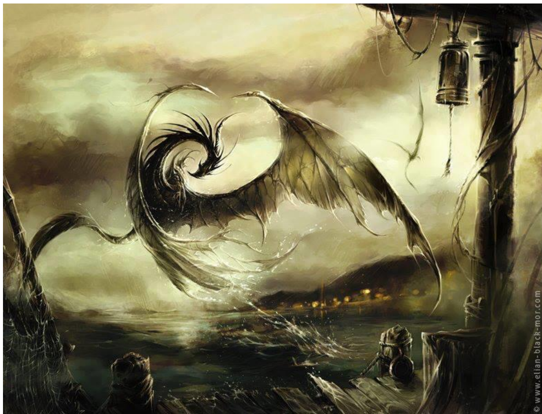
Dragon de Brume